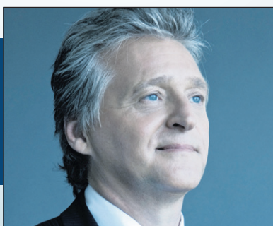
Gilbert Rozon président fondateur JUSTE POUR RIRE